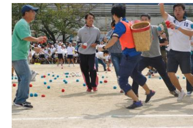
PTA競技おっかけ玉入れ