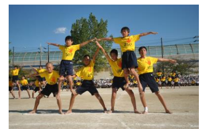
6年限界突破~未来へ~