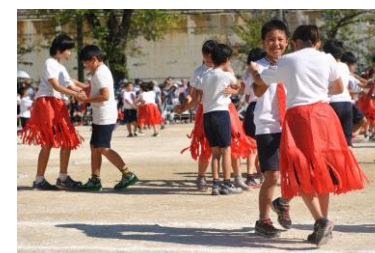
4年つながりを大切にしておどろうと思ったのだ。