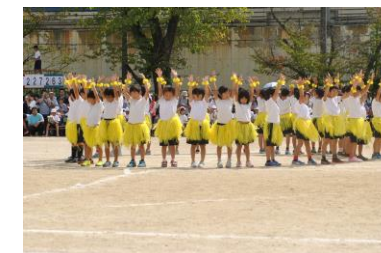
2年どこまでも~How Far I'll Go~