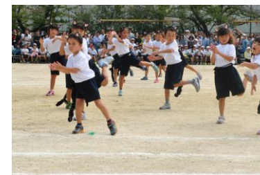
1年 Welcome to ジャパリパーク