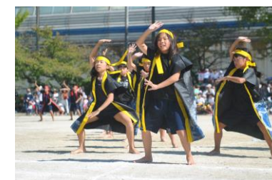
5年ソーランに挑む!!!