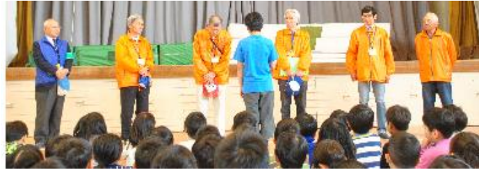
安全ボランティアさんに感謝の言葉を贈る児童会会長

※授業や行事で児童が活動する様子をお知らせいたします。学校便りや学年便り等で写真を掲載することがあります。ご了承願います。