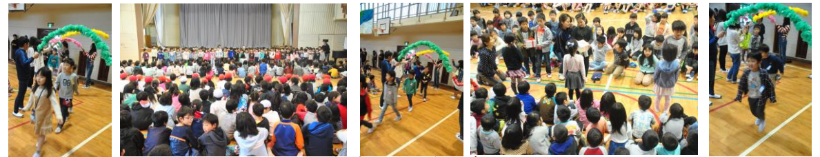
1年生をむかえる会