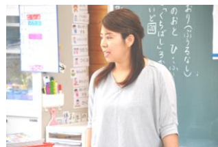
1 - 1 算数