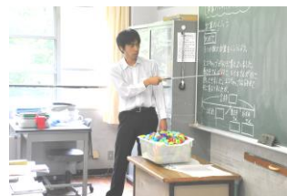
3 - 2 算数