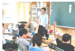
6 - 2 国語