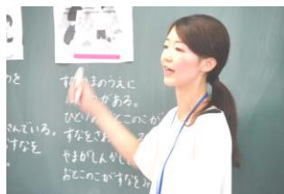
1 - 2 算数