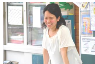
1 - 3 算数