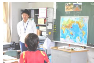
4 - 1 算数