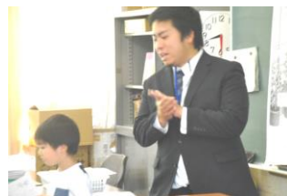
2 - 3 算数