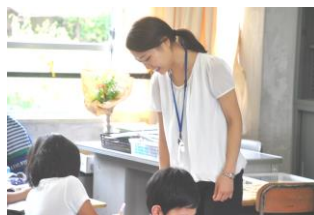
2 - 2 算数