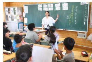
6 - 1 国語