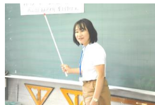
3 - 1 算数