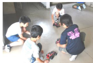
4 - 2 理科