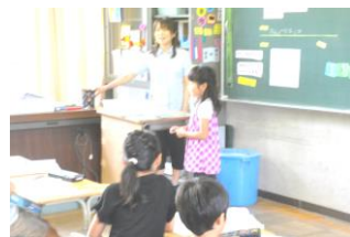
2 - 1 外国語