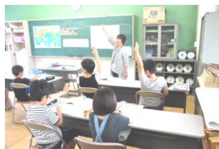
4 - 1 算数