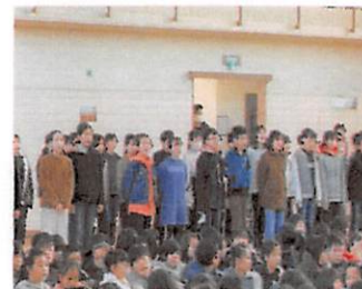
5年：歌「明日をつなぐもの」