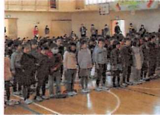
1年：歌「6年生っていいな」

2月28日、6年生を送る会が開かれました。1年生から5年生までが、卒業を祝うことばや歌などを披露しました。