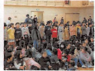
2年：「世界中の子どもたちが」