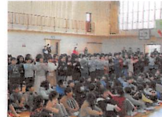
3年：歌「ききゅうにのってどこまでも」